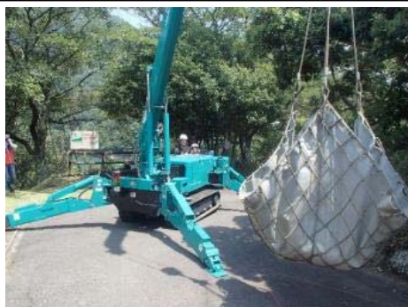
小型建設機械展示