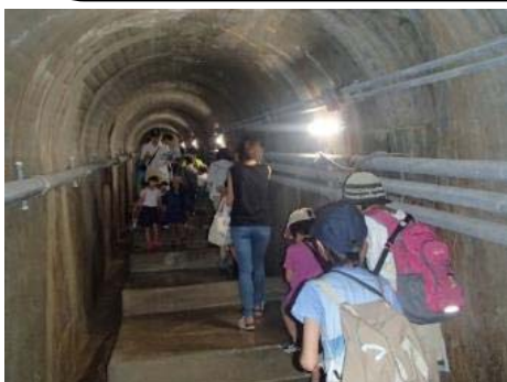
ダム底アドベンチャー