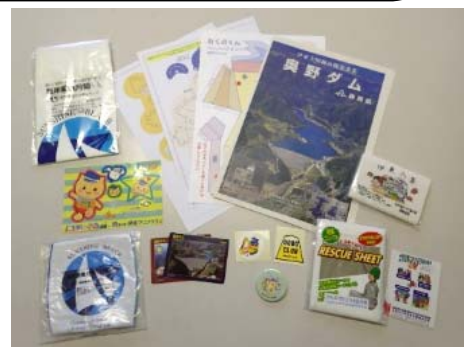
お土産もいっぱい